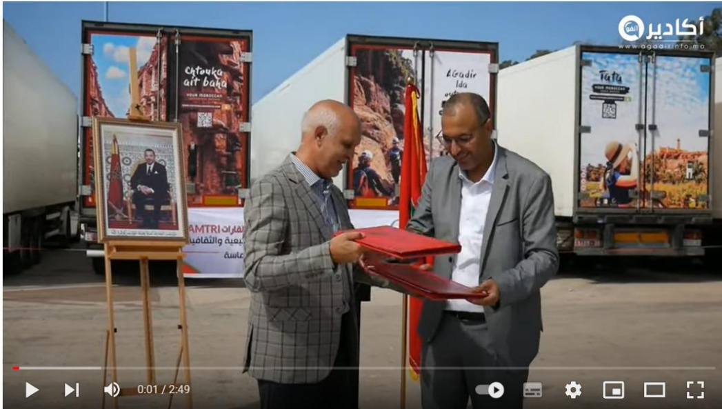
شراكة بين شبكة تنمية السياحة القروية والجمعية المغربية للنقل الطرقي تعزز السياحة القروية بجهة سوس